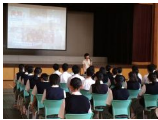
裁判後、学校で行われた朝大生のジュネーブでの活動報告

この中で、被告(国)の主張が焦点化されました。ミレ通信3号で掲載しましたが、再度、双方の主張、見解を整理してみました。